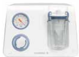
Versione per carrello