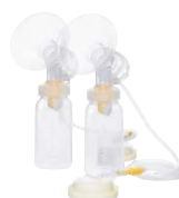
Set per tiralatte Symphony

Per gli ospedali con prassi di sterilizzazione e pulizia tradizionali, Medela fornisce inoltre una gamma completa di set per tiralatte, bottiglie per latte materno e tettarelle standard riutilizzabili. Questi prodotti possono essere utilizzati da più madri dopo un adeguato ritrattamento.